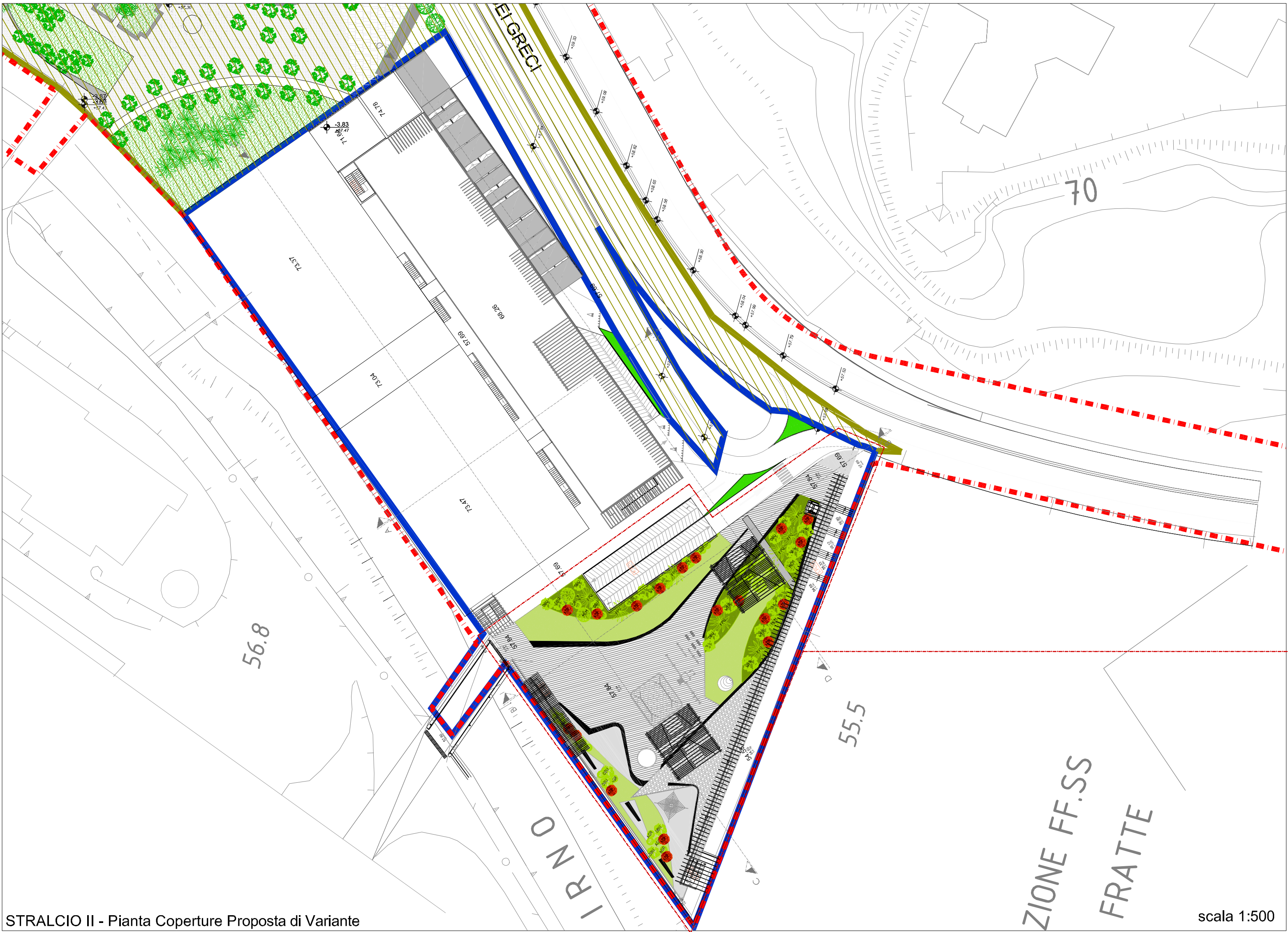
STRALCIO II - Pianta Coperture Proposta di Variante