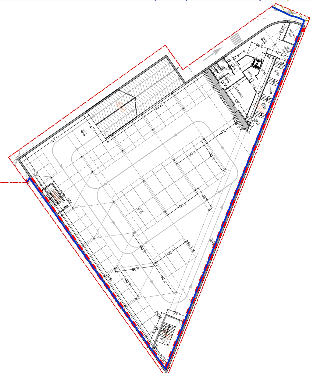
STRALCIO II - Pianta quota +54.55 Park interrato Proposta di Variante